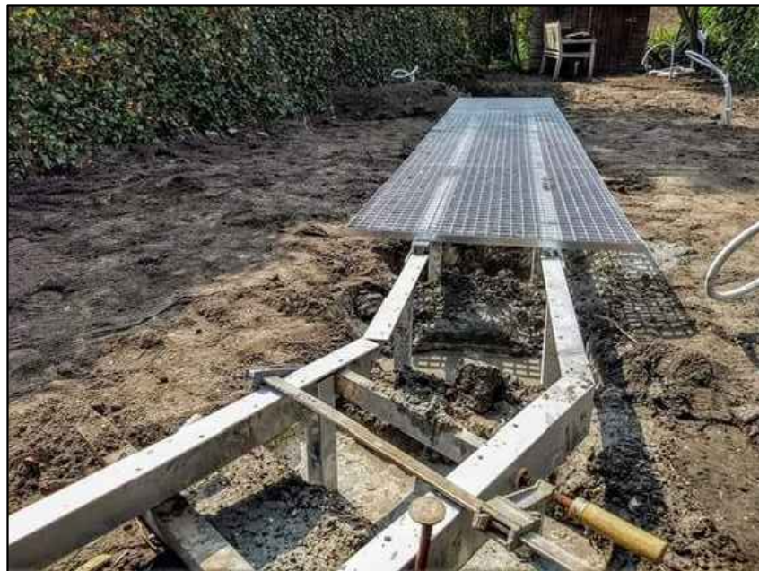
אופן ביצוע האלמנט