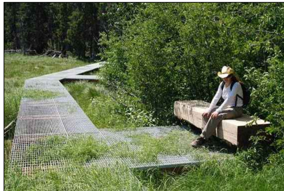
שביל מרחף ממתכת לדוגמה